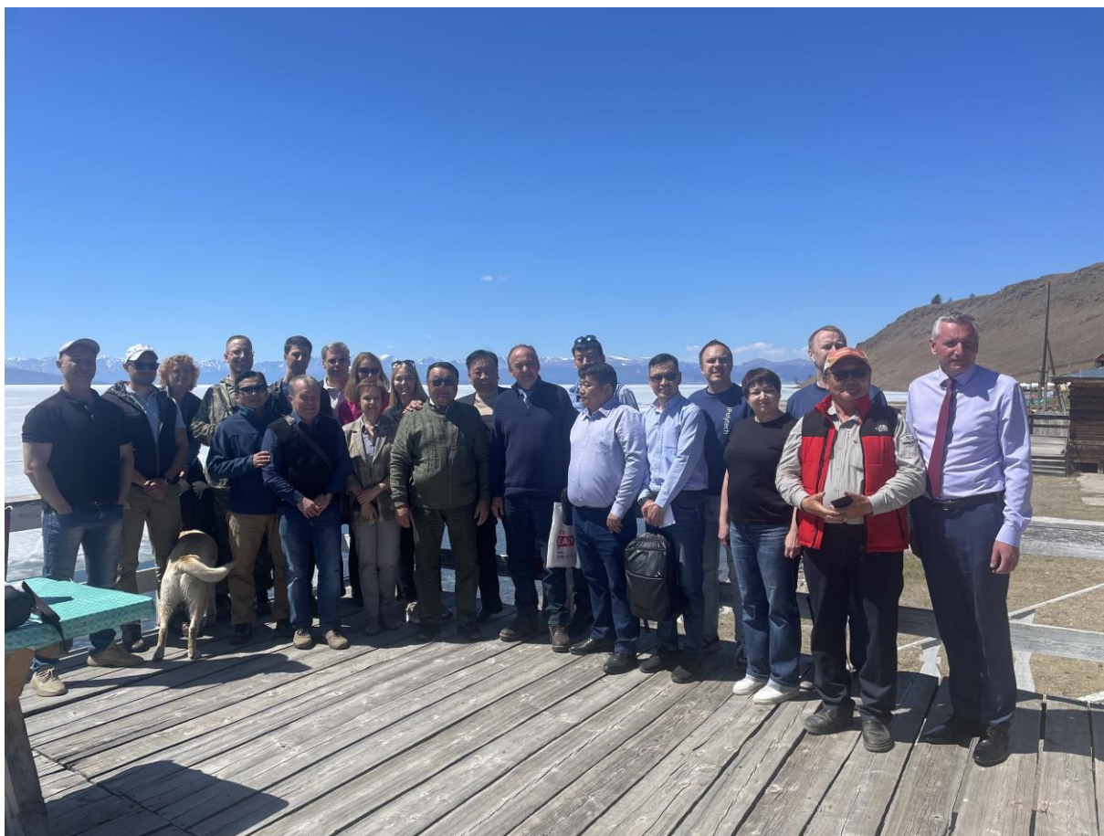
Участники Международного научного семинара институтов Академии наук Монголии и Сибирского отделения РАН (п. Ханх, Монголия, 22.05.2022)

3. Международная научная конференция «Байкал и Хубсугул – экологические и экономические проблемы», 08-11.11.2022, г. Улан-Батор, Монголия.