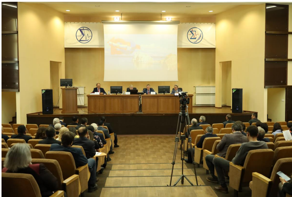
Пленарное заседание Международной научной конференции «Россия и Монголия: результаты и перспективы научного сотрудничества»

1. Международная научная конференция «Россия и Монголия: результаты и перспективы научного сотрудничества», приуроченная к 100-летию установления дипломатических связей и 50-летию открытия Генерального консульства Монголии в Иркутске, 06-08.04.2022, г. Иркутск.