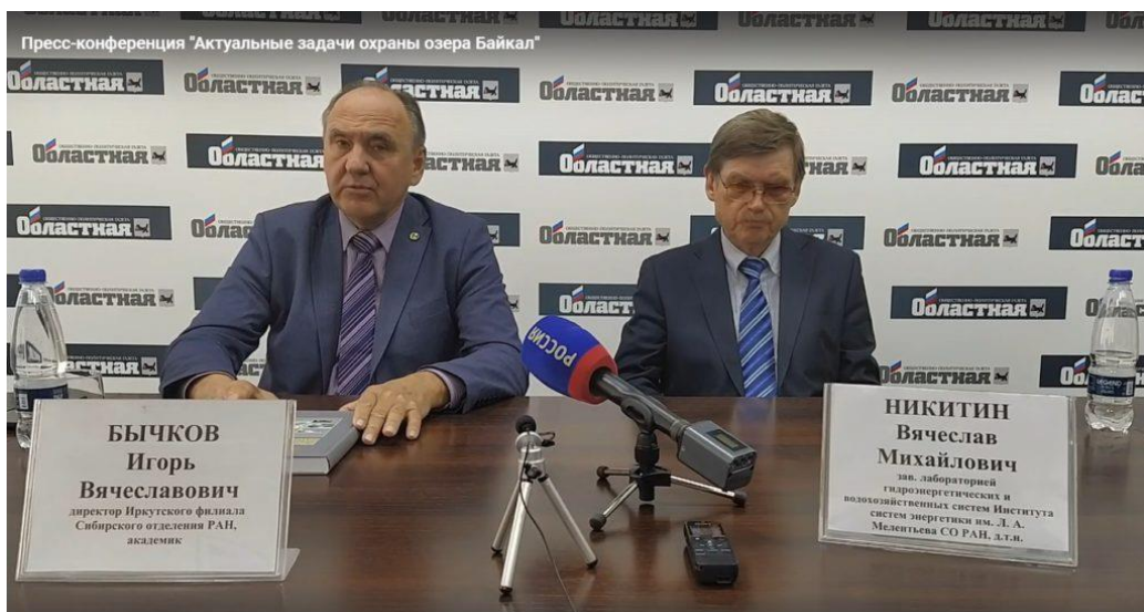
Пресс-конференция в пресс-центре газеты «Областная»

Постановлением Президиума СО РАН от 22.10.2020 № 283 было утверждено положение о Почетной грамоте Иркутского филиала СО РАН. Решениями бюро Президиума ИрФ СО РАН в 2022 году Почетной грамотой ИрФ СО РАН награждены 60 сотрудников академических и образовательных учреждений Иркутской области, а также кафедра общей гигиены Иркутского государственного медицинского университета.