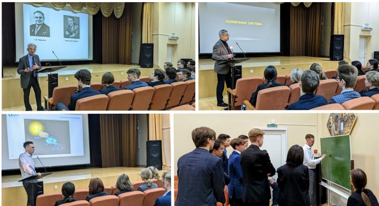
Лекции для учащихся базовых школ РАН

Под руководством ученых лицеисты осваивали следующие дополнительные общеобразовательные программы научной направленности: Математическое моделирование и оптимизация; Научное познание мира;