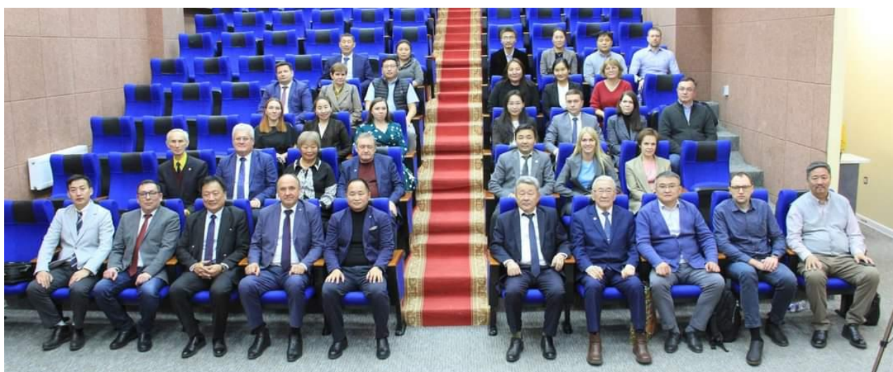
Участники Международной научной конференции «Байкал и Хубсугул – экологические и экономические проблемы» (Монголия, г. Улан-Батор)

3. Международная научная конференция «Байкал и Хубсугул – экологические и экономические проблемы», 08-11.11.2022, г. Улан-Батор, Монголия.