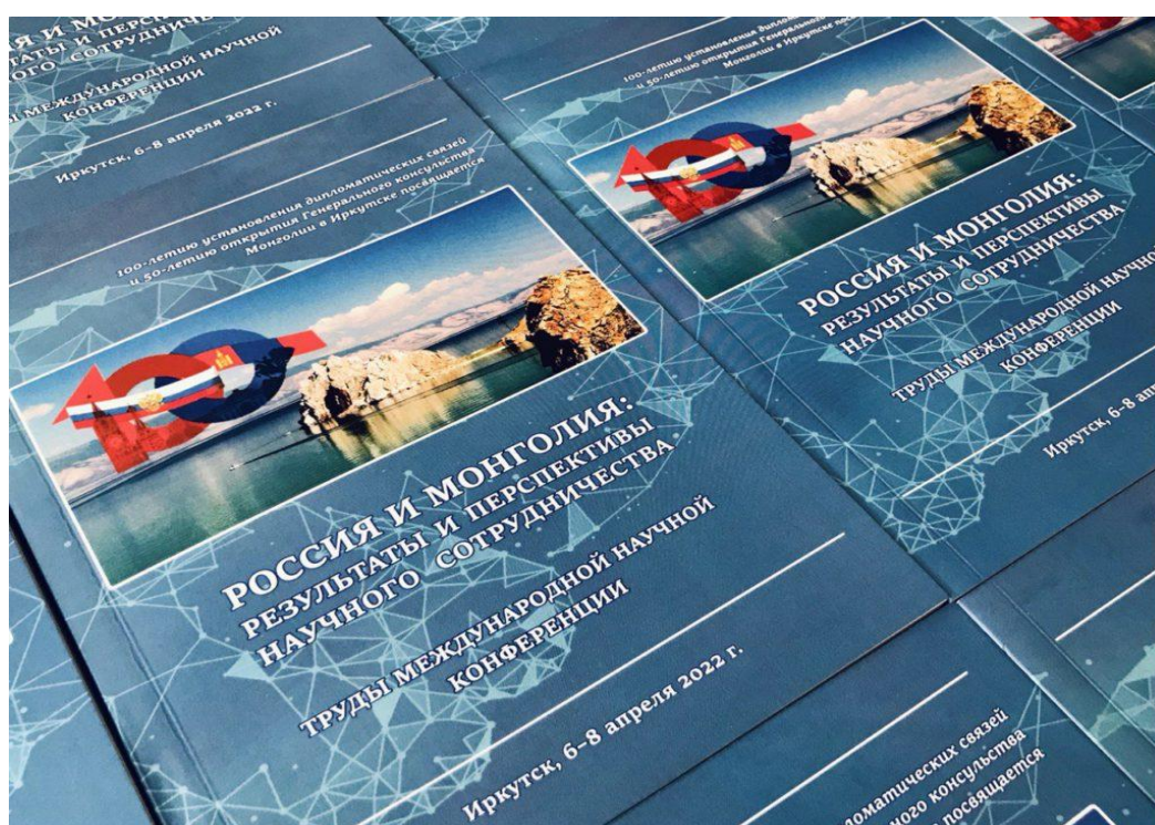
Сборник трудов Международной научной конференции «Россия и Монголия: результаты и перспективы научного сотрудничества»

В рамках пленарного заседания конференции заслушано 12 докладов, посвящённых истории, современному состоянию и перспективам научного сотрудничества Монголии и Российской Федерации. На заседаниях шести секций, включая молодёжную, заслушаны 127 докладов монгольских и российских учёных по актуальным проблемам биологии, географии, экологии, биологии, химии, физики, астрономии, энергетики, математики, информатики и медицины. По итогам работы конференции издан сборник трудов, проиндексированный в РИНЦ.