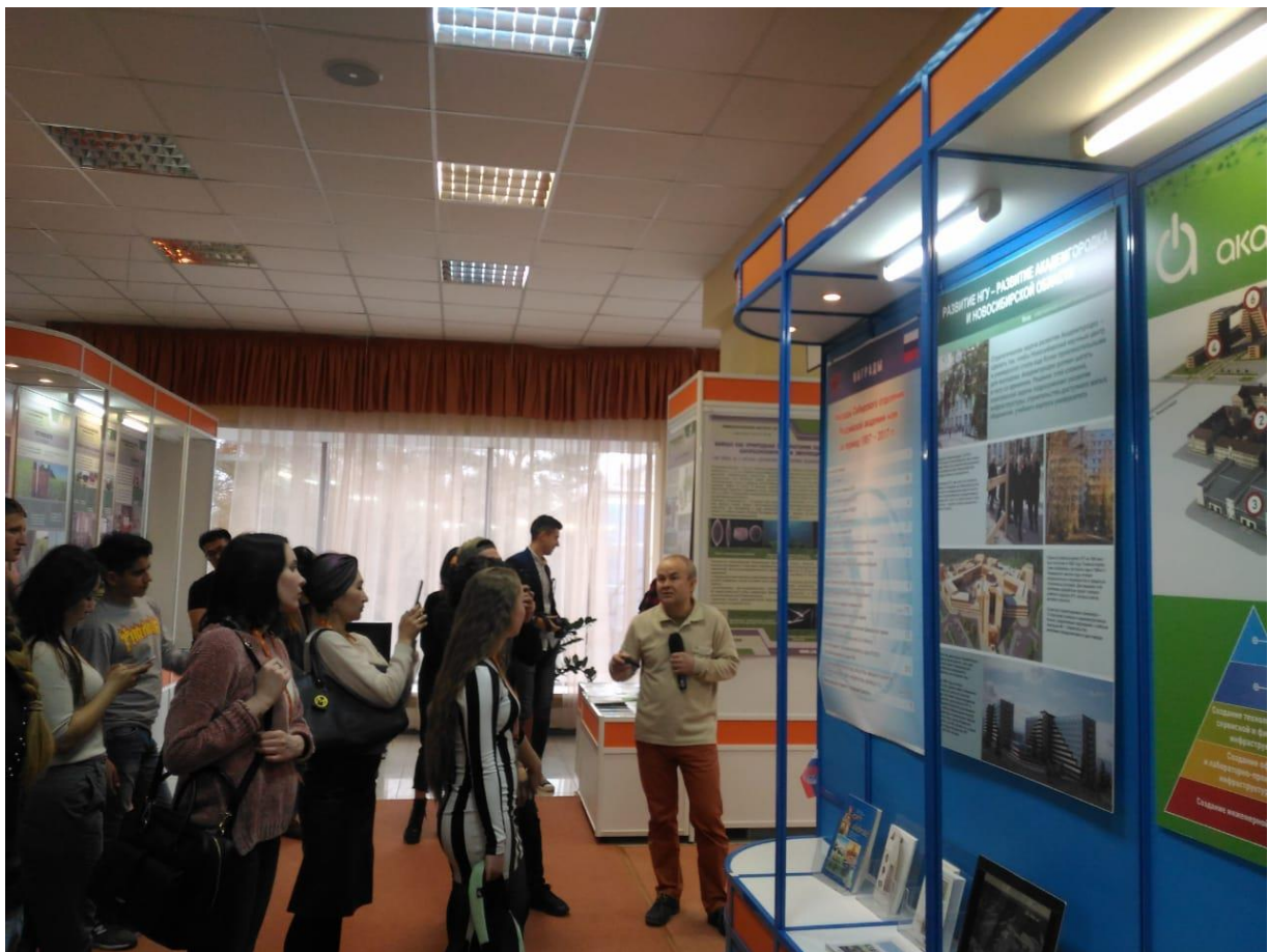
Экскурсия по постоянной выставке «Наука Сибири»