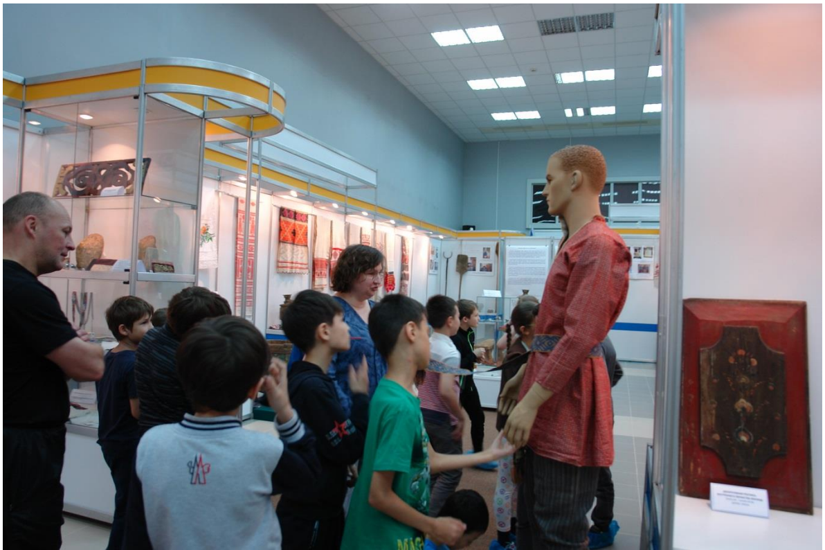
Экскурсия по временной выставке «Русская традиция в Сибири»