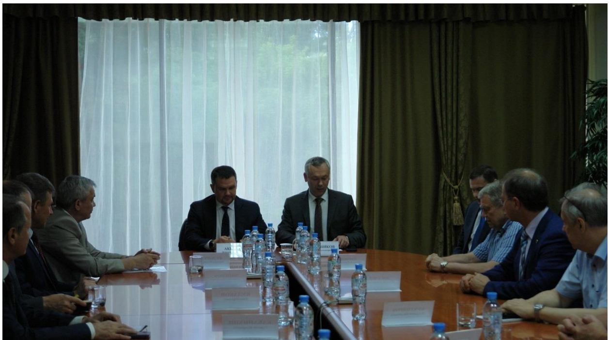
Заместитель председателя Правительства РФ Акимов М.А. и губернатор Новосибирской области Травников А.А. 3 июля 2018 г.