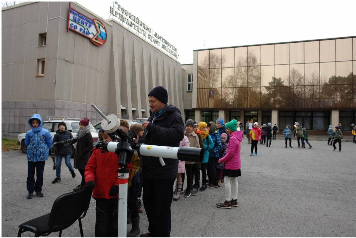
Фестиваль науки. Планетарий в Выставочном центре