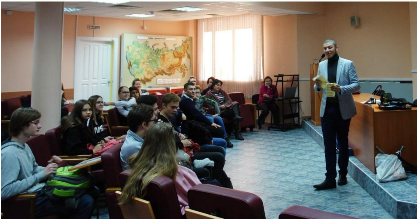
Презентация СибУПК (профориентация)