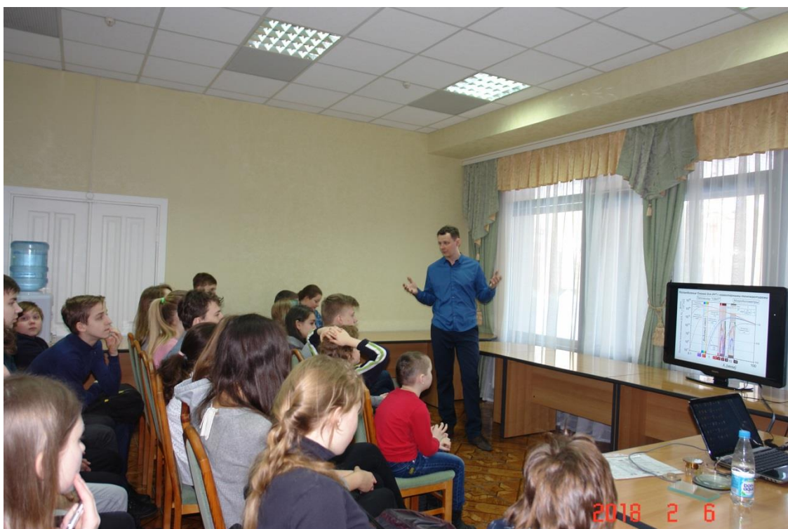
Дни науки. Демонстрация тепловизора (ИФП СО РАН)