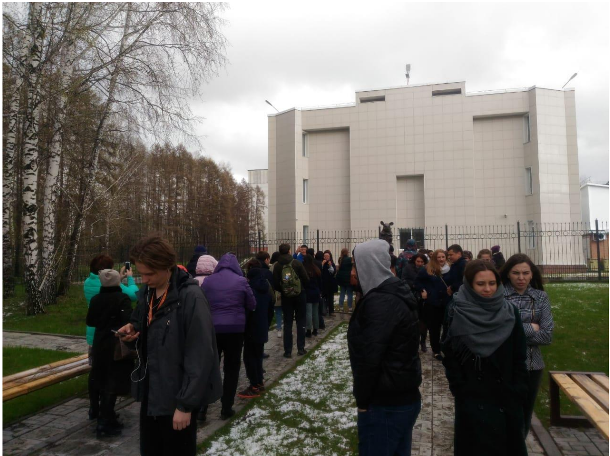
Экскурсия по Академгородку