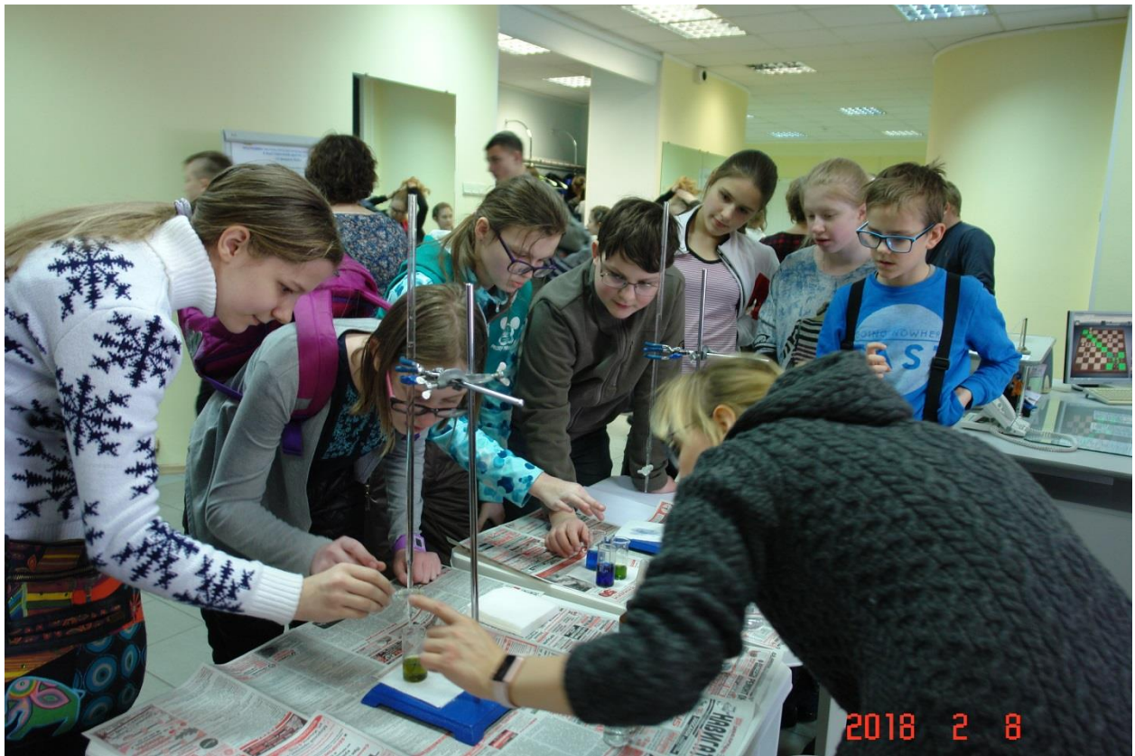
Дни науки. Химические опыты (НОЦ НГУ МДЭБТ)