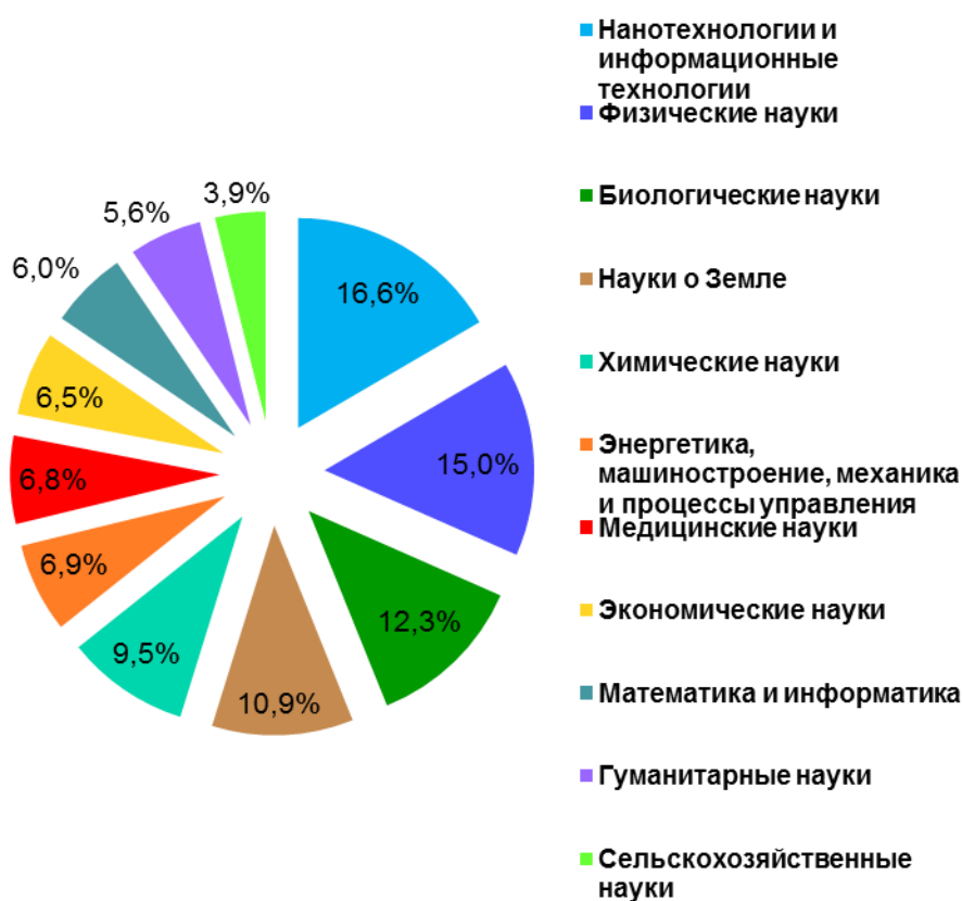
Рис. 2. Распределение новостей на Портале СО РАН по направлениям науки

В 2018 году более 1800 новостей на Портале СО РАН были связаны с определенной предметной областью исследований, распределение по тематикам представлено на рис. 2.