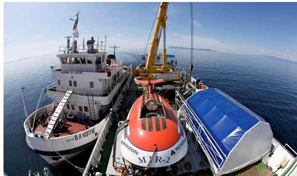
Фото 2. Успешно прошел второй полевой сезон экспедиции «Миры» на Байкале.