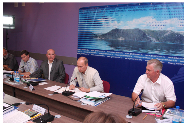
Фото 8. Совещание по проблемам озера Байкал (1 августа 2009 г.).