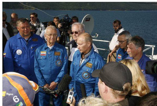
Фото 6. Председатель Правительства РФ В. Путин в составе звездной команды «Мир».