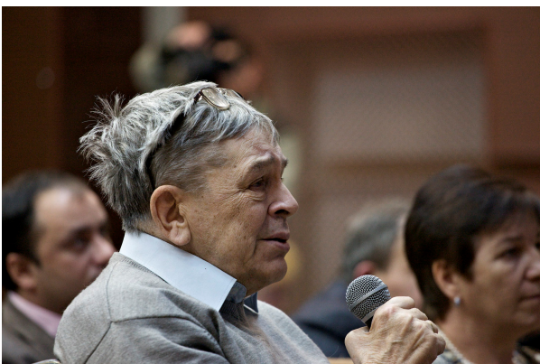
Фото 5. В докладе академика М. А. Грачева прозвучал обстоятельный анализ статей ФЗ «Об охране озера Байкал» (28 декабря 2009 г.).