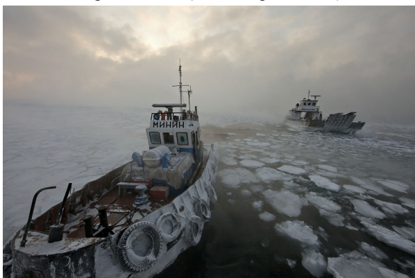
Фото 7. Зима на Байкале.