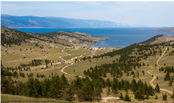
Фото 1. Малое море Байкала.