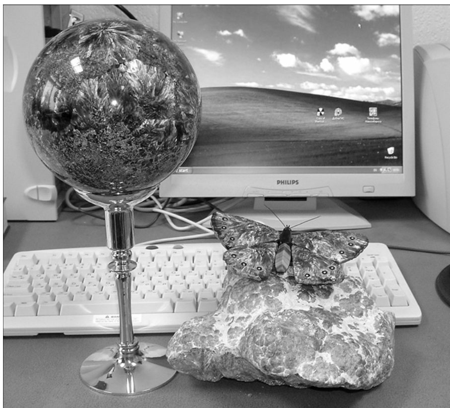
Изделия из поделочных камней. Центральный сибирский геологический музей.