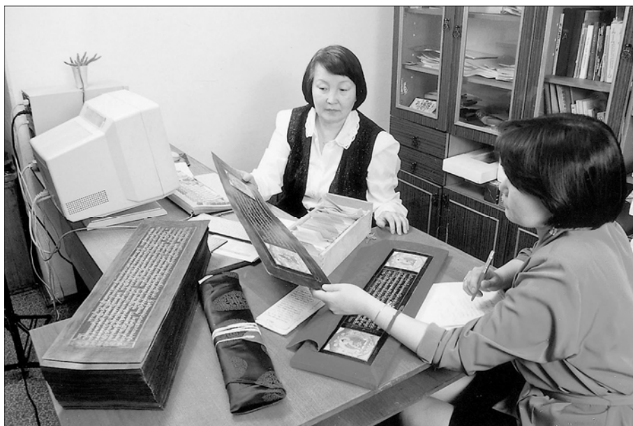
В Центре восточных рукописей и ксилографов ИМБГ.