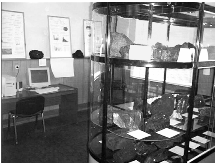
Фрагмент экспозиции Музея угля ИУУ СО РАН.