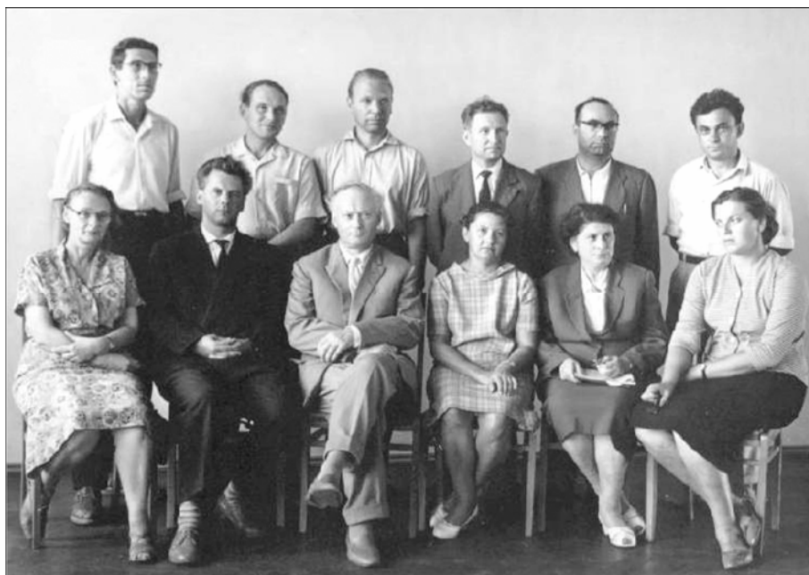
Члены Первого Ученого совета института, 1962 г. Из экспозиции мемориальной комнаты Г. К. Борескова в Институте катализа СО РАН.